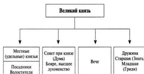
Рисунок 2. - Управление древнерусским государством

Независимо от содержания (схемы, графики, диаграммы, фотографии и пр.) каждая иллюстрация обозначается словом «Рисунок», с указанием номера и заголовка, например: