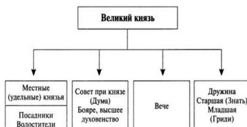
Рисунок 2. Управление древнерусским государством

При цветном исполнении рисунков следует использовать принтер с возможностью цветной печати. При использовании в рисунках черно-белой печати следует применять черно-белую штриховку элементов рисунка.